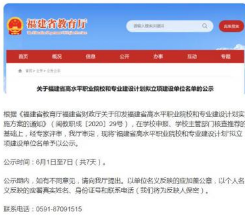
2020年为建设性代业校